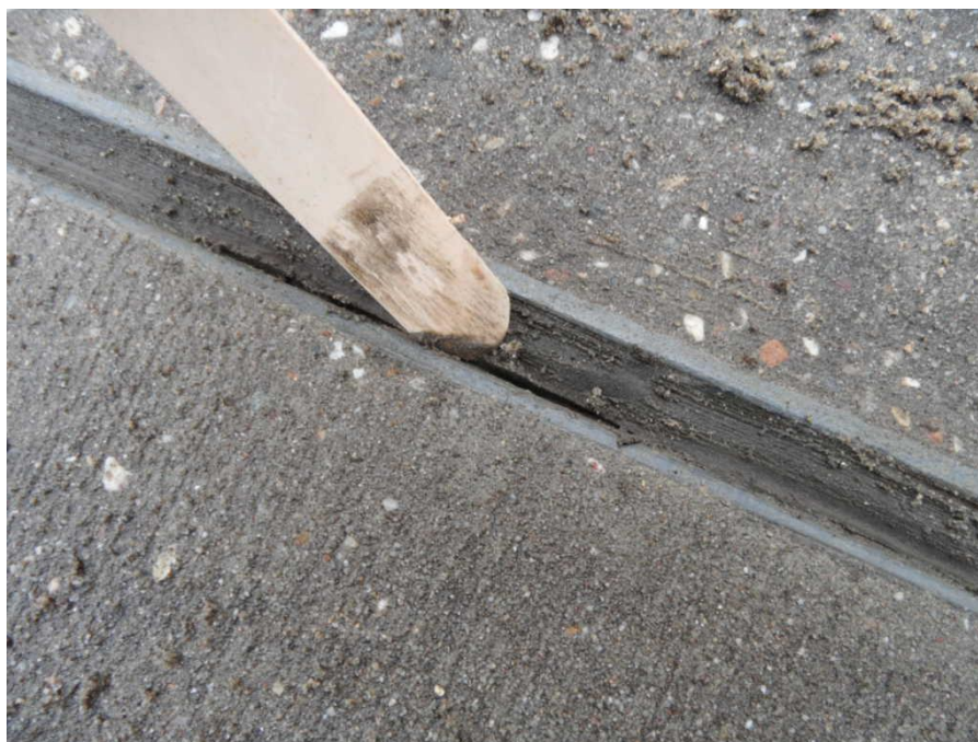
Foto: afdichting onthecht.

Indien de DI hechtingsverlies aan de bovenzijde constateert, wordt dit aangemerkt als een onvolkomenheid tenzij hechtingsverlies over de volledige hoogte van het hechtvlak aanwezig is. Onthechting over de volledige hoogte van het hechtvlak is een gebrek.