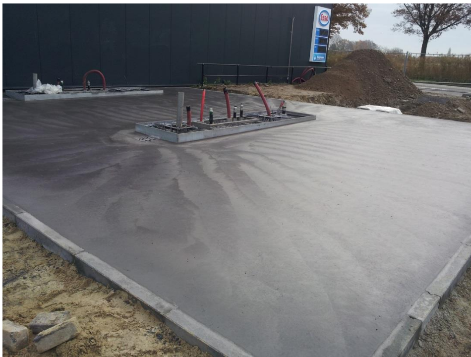
Foto: aanleg van vloeistofdichte betonvloer.