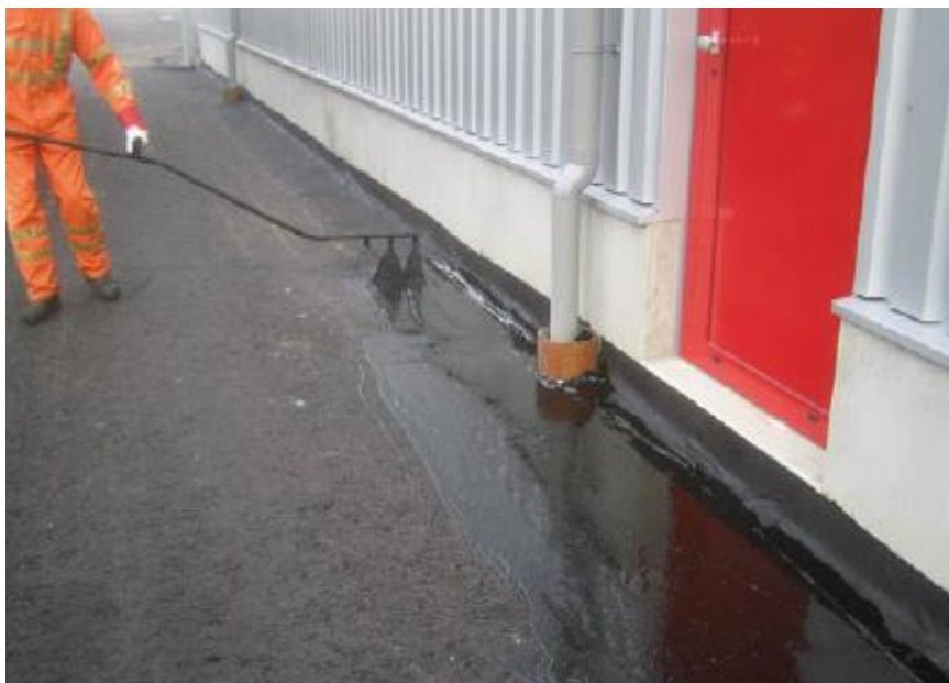
Foto: voorbeeld kritieke plaats ter plaatse van aansluiting.

Dit houdt in dat de DI ten minste per strekkende meter viermaal beoordeelt of: