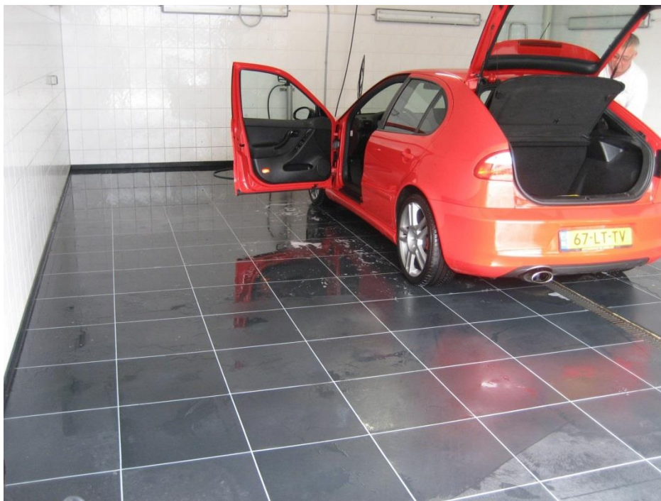
Foto: vloer uitgevoerd met kunststof elementen.