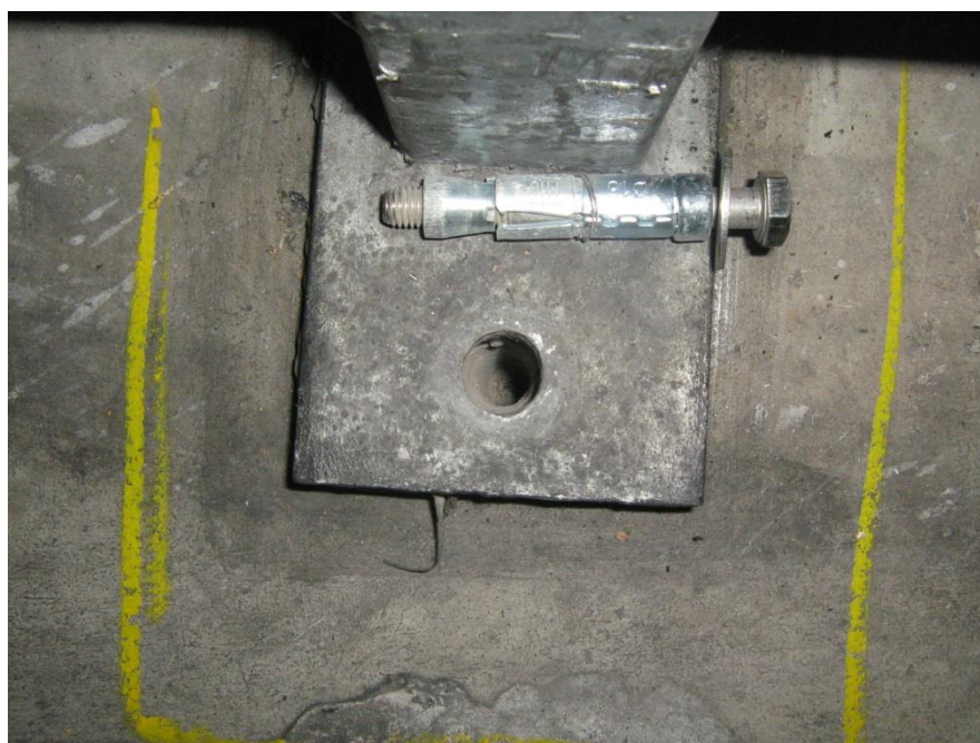
Foto: voorbeeld niet juist afgedicht boorgat.

Het overtuigen kan door steekproefsgewijs bij enkele boorgaten de diepte te bepalen. De steekproef mag als representatief voor de voorziening worden beschouwd wanneer bij de beoordeling van vijf opeenvolgende boorgaten, die zich op kritische plaatsen bevinden, is geconstateerd dat het boorgat tot een diepte van maximaal \frac{1}{3} van de dikte van de voorziening is aangebracht. Wanneer één of meer boorgaten dieper is aangebracht dan \frac{1}{3} van de dikte van de voorziening dan moet de DI ervan uitgaan dat de bevestigingspunten niet vloeistofdicht zijn aangebracht en als gebrek worden aangemerkt.