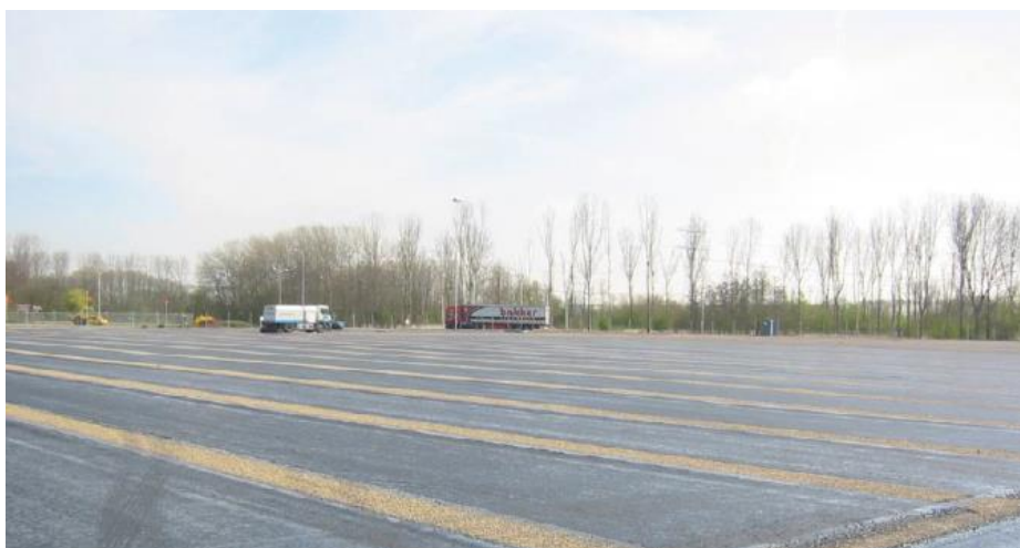
Foto: aanleg vloeistofdicht asfaltconstructie.

Deze informatie dient de DI te betrekken bij de visuele inspectie die direct na oplevering (uiterlijk een maand na de laatste tussentijdse inspectie) van de voorziening wordt uitgevoerd. Na afloop van de wettelijke inspectietermijn moet de voorziening als een 'bestaande voorziening' worden beschouwd.