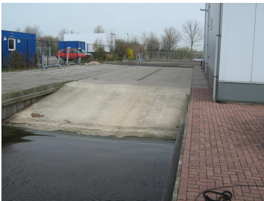
Foto: voorbeeld aandachtspunt afschot richting oppervlaktewater.

Wanneer vloeistoffen van de voorziening af kunnen stromen, anders dan naar een ontvangtpunt, dan moet dit als een gebrek worden beschouwd.