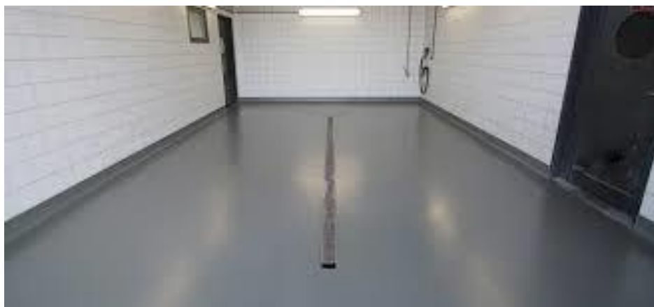
Foto: voorbeeld kunstharsgebonden voorziening.