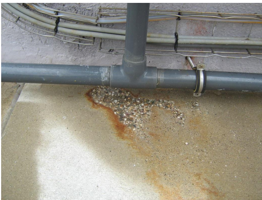
Foto: voorbeeld chemische aantasting.

Door kloppen of strijken met een hiervoor geschikt gereedschap kan de DI vaststellen of volledige hechting plaatsvindt.