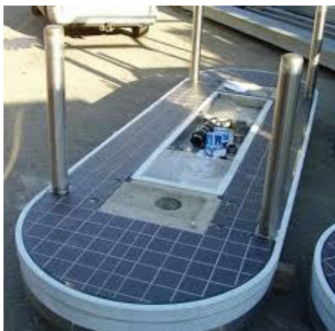
Foto: pompeiland voorzien van tegels.