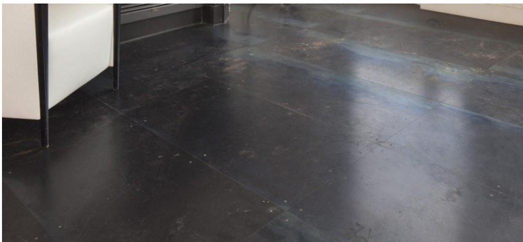
Foto: voorziening van aan elkaar gelaste metaalplaten