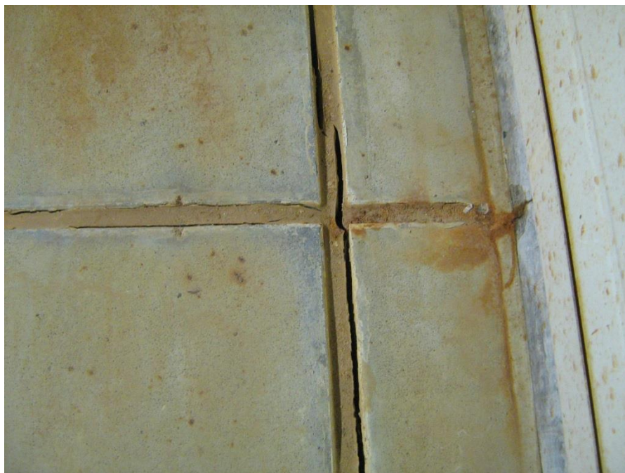
Foto: beschadigde kitvoeg.