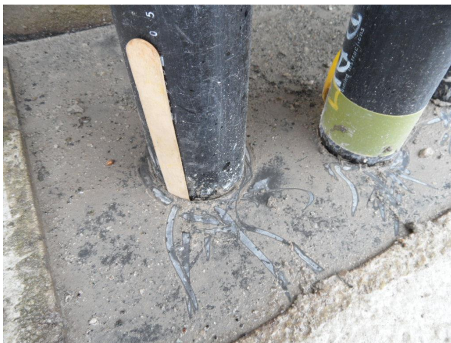
Foto: voorbeeld niet afgedichte doorvoer.

Ter plaatse van doorvoeren in de voorziening beoordeelt de DI visueel of vloeistoffen langs of door de doorvoeren, al dan niet voorzien van een afdichting met voegvullingsmassa of een pakking, de niet belaste zijde bereiken dan wel kunnen bereiken.