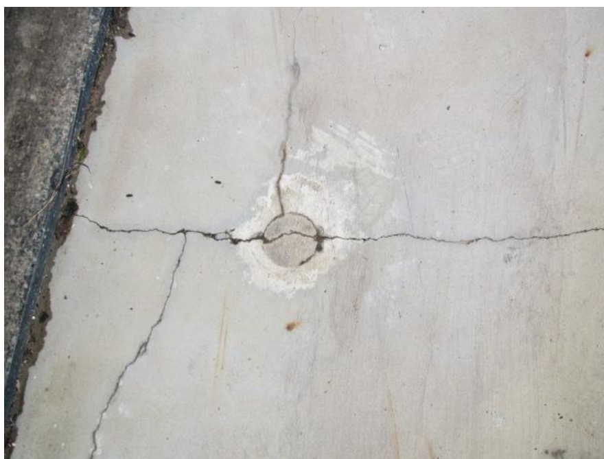
Foto: voorbeeld scheurvorming.