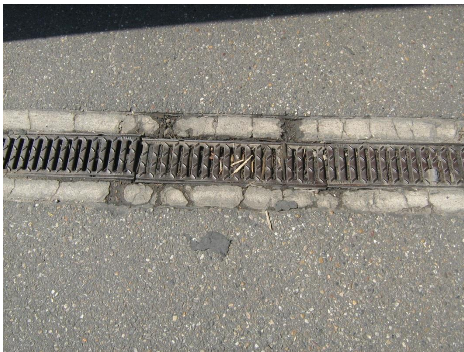
Foto: aansluiting met lijngoot niet vloeistofdicht afgewerkt.

Ook kan de DI door het uitvoeren van een nader onderzoek de vloeistofdichtheid van lassen, (stort-)naden en aansluitingen onderzoeken, in hoofdstuk 4 is omschreven hoe dit nader onderzoek uitgevoerd kan worden.