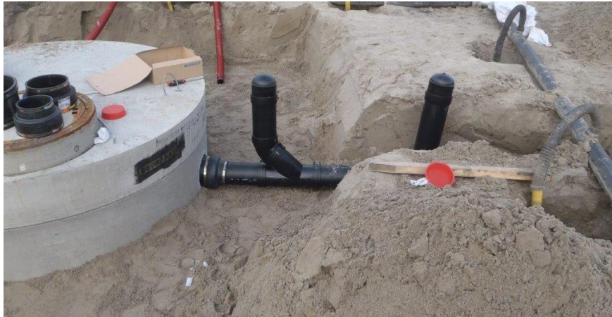
Foto: voorbeeld van voorzieningen voor controle van de bedrijfsriolering op waterdichtheid. Aansluiting van de bedrijfsriolering (hdpe) op de prefab betonnen slibvangput.

Om het beproeven van de dichtheid uit te kunnen voeren monteert de aannemer in de toevoerleiding naar de slibvangput, kort voor de aansluiting daarop, een T-stuk 90° en een T-stuk 45° of een andere installatie waarmee leidinggedeelten eenvoudig kunnen worden afgesloten en beproefd.