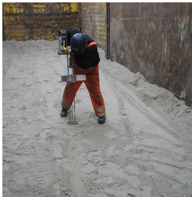
Foto: voorbeeld van het meten van de verdichting van het zandpakket.