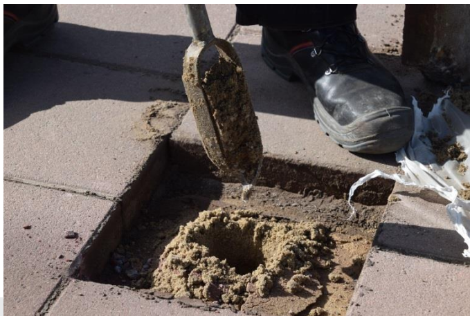
Uitvoering handboring onder verharding.

Jaarlijks voert de organisatie een audit op de documentatie uit op kantoor van iedere vestiging die op het certificaat is geregistreerd. Jaarlijks voert de organisatie ook een interne audit op kantoor van iedere vestiging uit om de andere eisen uit dit certificatieschema te auditten, waarbij zij per interne audit minimaal twee uitgevoerde projecten audit. Deze interne audit omvat het gehele uitvoeringstraject van de werkzaamheden door de organisatie in de geselecteerde projecten die vallen onder de reikwijdte van dit certificatieschema. De interne auditor is onafhankelijk van de te beoordelen processen en projecten.