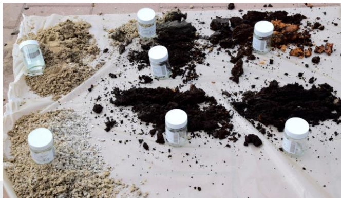
Vorbereiden nemen van grondmonsters.

De organisatie documenteert alle waarnemingen en de resultaten van de vergelijking. Als de organisatie afwijkt van de beschreven uitvoering en frequentie, dan legt zij dit vast met de reden waarom hiervan is afgeweken.