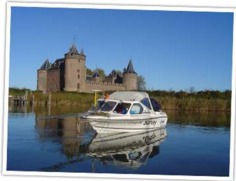
Foto: IVO-Opwater side scan sonar onderzoek. Over het algemeen wordt side scan sonar gebruikt voor het opsporen van fenomenen, en wordt multibeam echoloding gebruikt voor het nauwkeurig in beeld brengen van fenomenen, ofwel de mogelijke archeologische waarde.