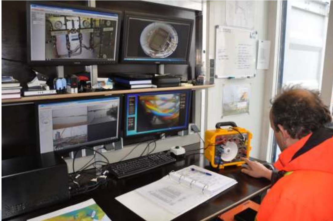
Foto: Audiovisuele registratie van waarneembare fenomenen bij een onderzoek onder water. Deze registratie dient voor het identificeren en interpreteren van de vindplaats.