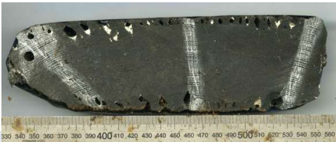
Foto: Houtmonster van de huidplank van een VOC-schip. De gaten in het hout zijn veroorzaakt door paalworm. Het oppervlak van het hout is met een mesje bijgesneden en hierna is krijtpoeder in de houtcellen geklopt. Hierdoor zijn de ringen nu goed zichtbaar. De oudste ring in dit hout is gevormd in 1484 n.Chr. en de jongste ring in 1599 n.Chr.