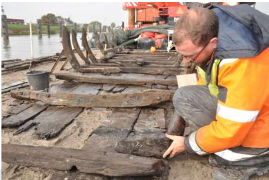
Foto: Tijdens het veldwerk wordt het uitvoeren van de selectie conform de richtlijnen (de)selectie (PS06bw, tabel 1) overgelaten aan een KNA Archeoloog Ma specialisme Waterbodems en de betrokken (Senior) KNA Specialisten.