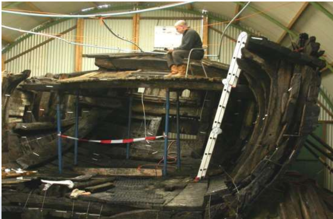
Foto: Het onderzoeken van scheepsresten is een specialisme binnen de archeologie en kent daarom een eigen actor: de KNA Specialist Scheepsarcheologie.

In OS11 wordt onderscheid gemaakt tussen de KNA Specialist Conserveren en andere KNA Specialisten. Waar de tweede groep kennis heeft van specifieke, archeologisch-inhoudelijke kenmerken van een bepaalde materiaalgroep, heeft de eerste specifieke kennis van de wijze waarop verschillende materialen het beste behandeld kunnen worden, zowel qua stabilisatie als qua conservering.