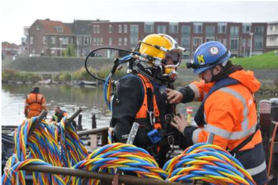
Foto: De complexe uitrusting van een KNA Onderwaterarcheoloog.

In de beoordelingsrichtlijn Archeologie (BRL SIKB 4000) zijn de competentie-eisen van de verschillende actoren opgenomen.