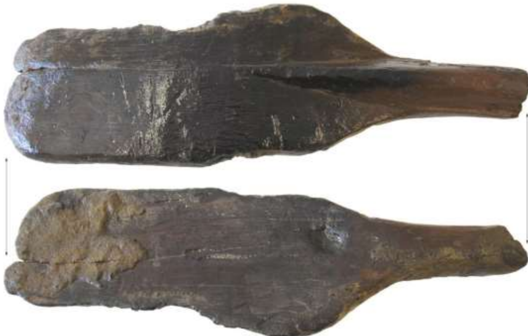
Foto: Hout kan nooit ongeconserveerd worden opgeslagen, zoals dit vroegmiddeleeuwse roeiblad van Naaldwijk.