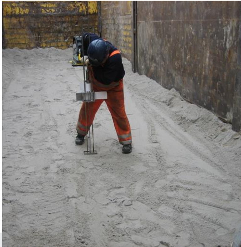
Foto: Voorbeeld van een controlemeting van de indringweerstand.