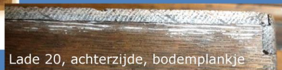
Lade 20, achterzijde, bodemplankje